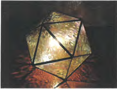
A ランプ (20面体)