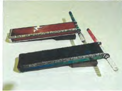
B カレイドスコープ (万華鏡)